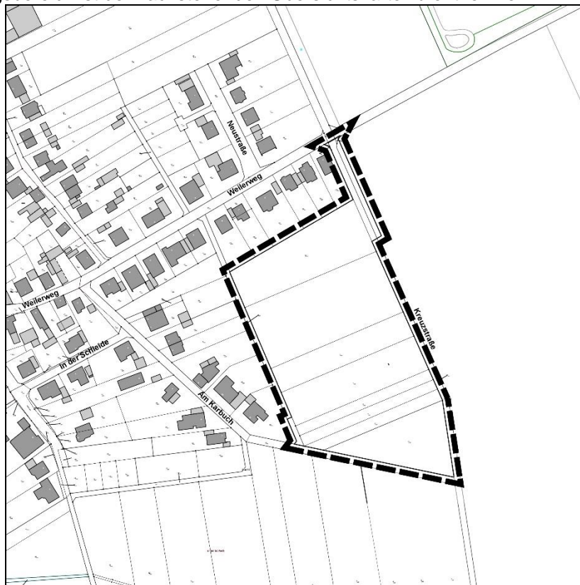
Übersicht zum räumlichen Geltungsbereich genodet, ohne Maßstab

Der Plangeltungsbereich ist der nachstehenden Übersichtskarte zu entnehmen.