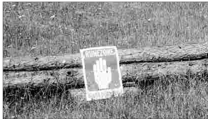
Verständlicherweise sind nicht alle Wege in der Drover Heide freigegeben.