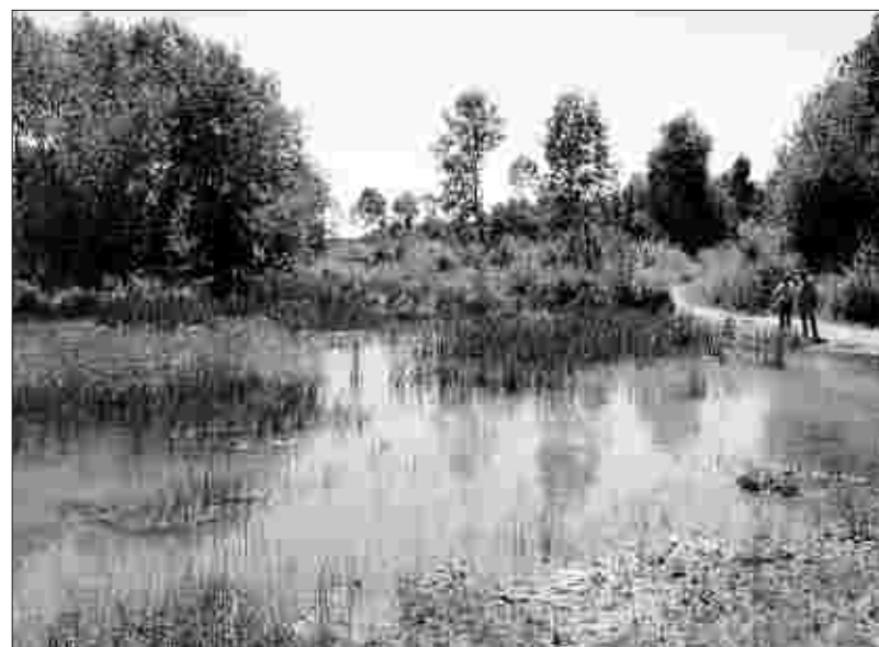
Für etliche der zahlreichen Feuchtbiotope waren neben der Bodenbeschaffenheit die Panzer bei ihren Übungsfahrten verantwortlich. Das zerfahrene Gelände bedankt sich heute mit einzigartiger Flora und Fauna.