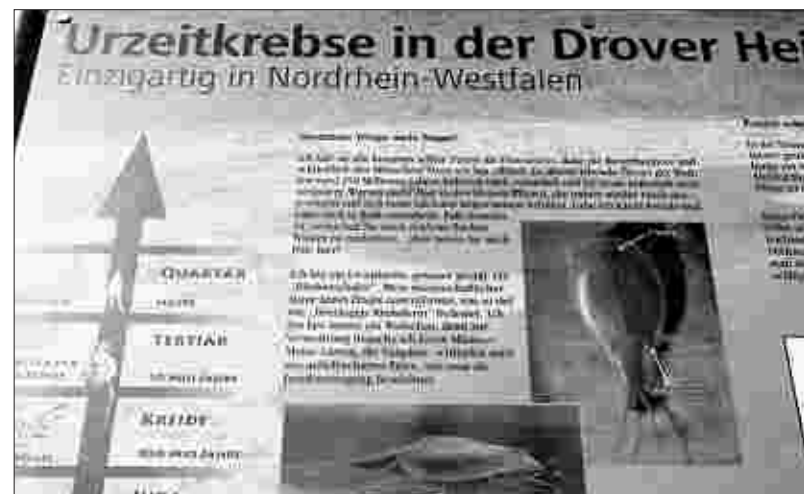
Eine Info-Tafel, die für sich spricht: Urzeitkrebse in der Drover Heide!