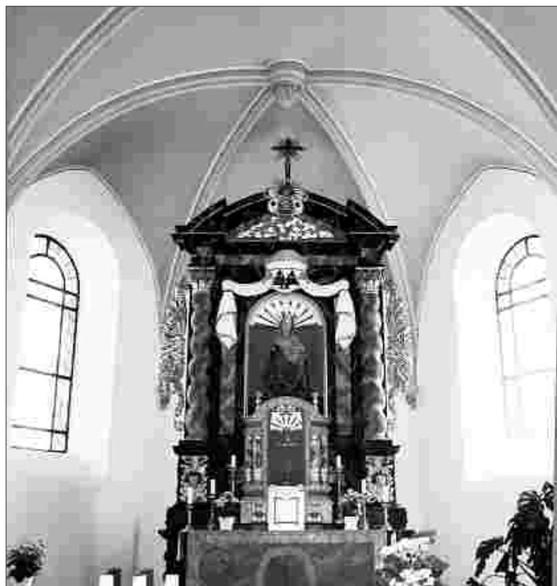
Ein Stopp, der sich lohnt: Das kleine Kirchlein in Ginnick ist meist offen, so dass man sich beispielsweise den interessanten Altar ansehen kann.

Schutzgebühr von 15 Euro auf das Konto des Autors Herbert Schartmann (KontoNr. 8387920 bei der Sparkasse Büsbach, BLZ 390 500 00) lieferbar; ebenso die zeitnäheren Tipps 52-102 bei einer Schutzgebühr von 16 Euro. Bitte geben Sie Ihre Anschrift deutlich lesbar in Druckbuchstaben an.