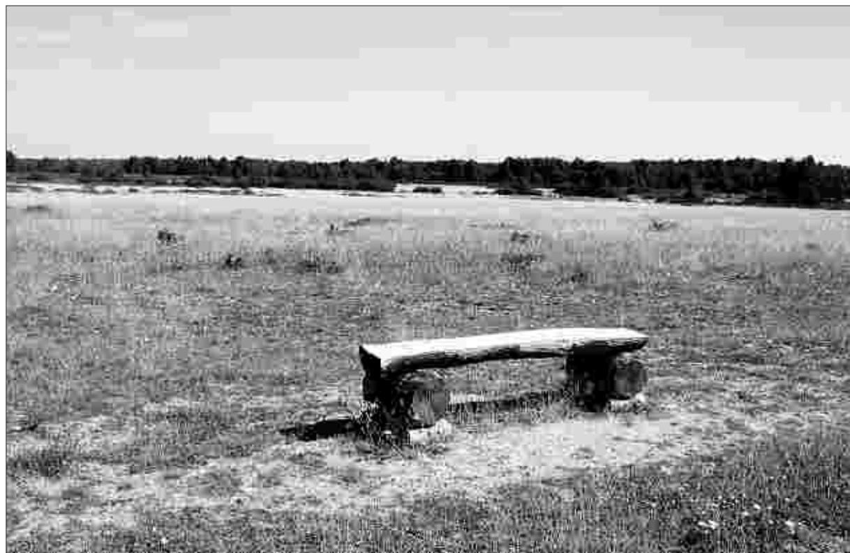
Eine einsame Bank in einer offenen Landschaft. Typisch für das Naturschutzgebiet „Drover Heide“, durch das der erste Teil dieser 13,1 Kilometer langen Wanderung führt.