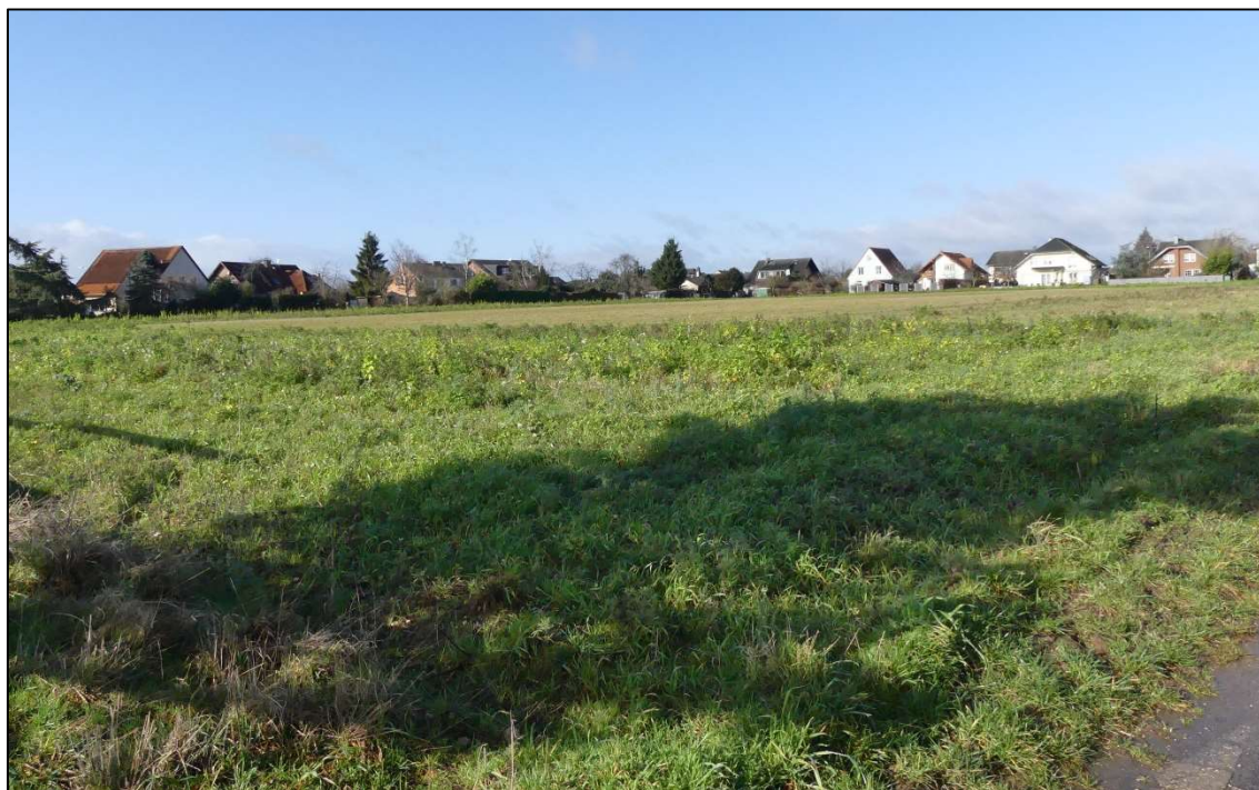
Abb. 3: Blick von der Südostecke auf das Plangebiet, ein verbrachter Acker.

Am 4. Februar 2020 fand eine Erstbegehung des Geländes statt. Die betroffene Ackerfläche ist in Abb. 3 zu sehen und völlig strukturlos. Die Planfläche hat durch ihre Lage und Größe ein eher geringes Lebensraumpotenzial für gefährdete Feldvogelarten. Allerdings liegen die für ein Vorkommen von Grauammer, Wachtel, Schwarzkehlchen oder Rebhuhn benötigten extensiven und störungsarmen Flächen direkt östlich der Kreuzstraße in Form von großen Blühflächen. Ein Vorkommen - auch auf der hiesigen Planfläche - konnte also an dieser Stelle nicht generell ausgeschlossen werden. Kiebitze halten i.d.R. größere Abstände zur Bebauung ein; ein Revier der Art ist sehr unwahrscheinlich. Am ehesten könnten Feldlerchen die Fläche selbst besiedeln. Bluthänflinge könnten in und an den Gehölzen auf der südlich angrenzenden Grünlandparzelle brüten.