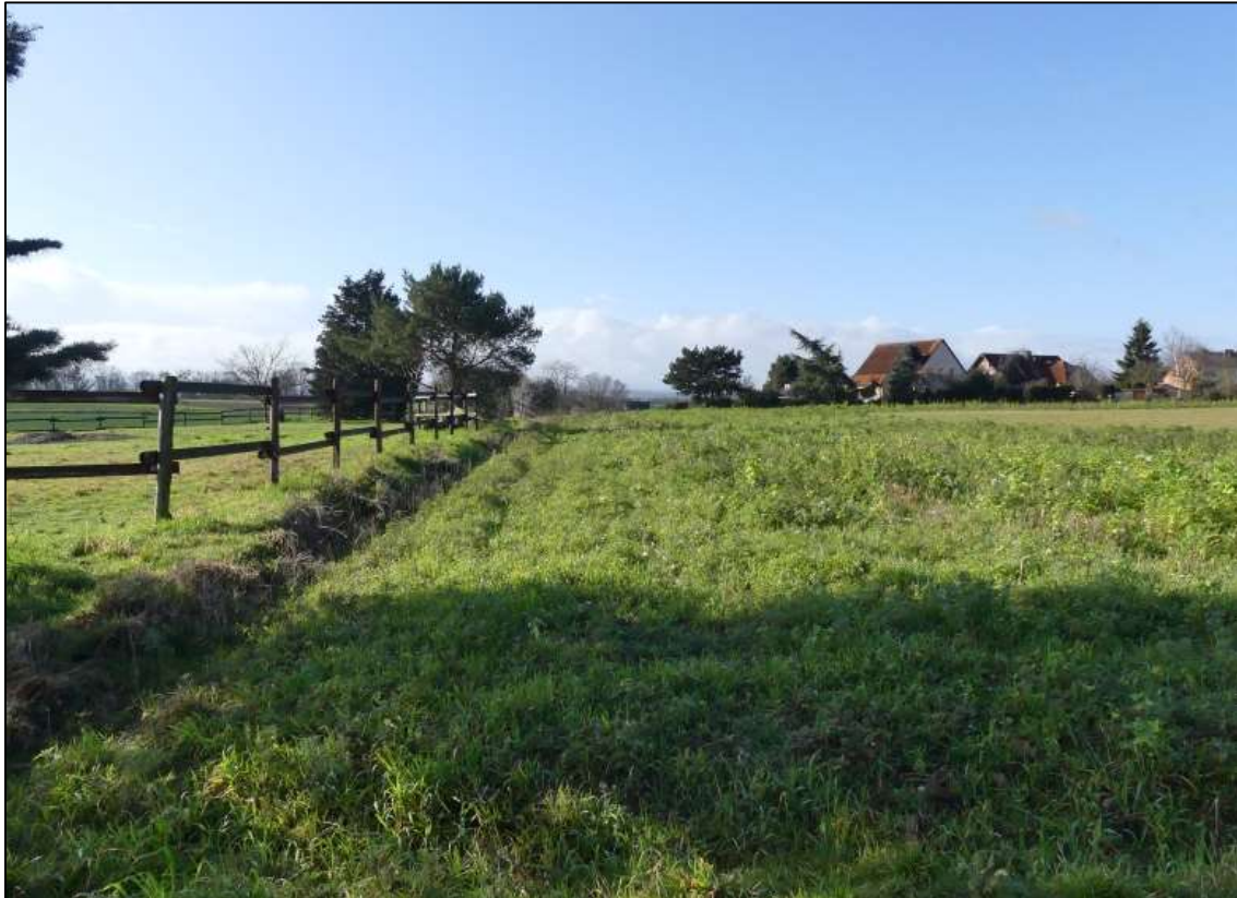
Abb. 4: Blick auf die Nadelgehölze des südlich (hier im Bild links) angrenzenden Flurstücks mit Grünland.

Die Fläche hat darüber hinaus wahrscheinlich eine geringe Bedeutung als Nahrungshabitat für Fledermäuse der Siedlung, insbesondere für die Zwergfledermaus. Ein Feldhamster-Vorkommen an dieser Stelle ist äußerst unwahrscheinlich. Weitere Artengruppen sind nicht betroffen.