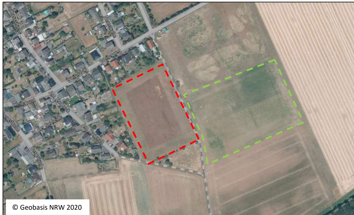
Abb. 2: Geltungsbereich des Bebauungsplans (rot). Im Luftbild liegen rechts große Brach- und Blühflächen (grün).

Das Gelände besteht aus Äckern, die derzeit brach liegen. Am nördlichen und westlichen Rand des Geltungsbereichs liegt der derzeitige Ortsrand von Disternich mit Wohnbebauung, östlich grenzen große offene Ackerflächen an und am Südrand liegen hinter einer kleinen Grünlandparzelle weitere Äcker und ein Gehöft. Etwa 300m nach Südosten beginnt das Marienholz, ein größeres zusammenhängendes Waldstück, teils mit Alteichen-Bestockung. Die Fläche ist somit von Norden und Westen eingefasst, öffnet sich aber nach Süden und Osten hin in die freie Landschaft. Direkt östlich liegen größere Bereiche, die als artenreiche Blühflächen genutzt werden.