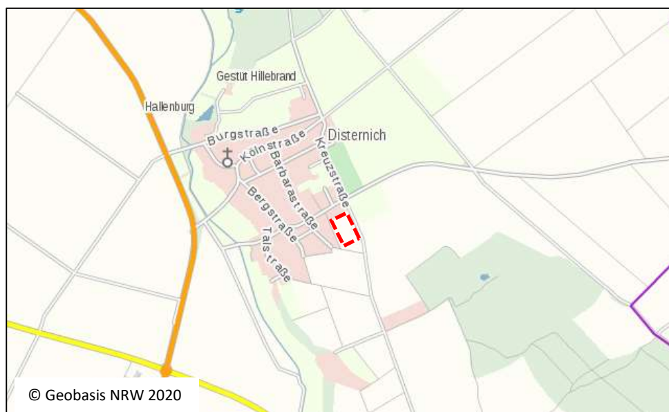
Abb. 1: Lage der Plangebietsfläche südöstlich von Vettweiß-Disternich.

Das Bebauungsplangebiet liegt am Südostrand von Vettweiß-Disternich, westlich der Kreuzstraße. Das Plangebiet umfasst die Flurstücke 70 bis 75, 99 und 369 in der Flur 17 der Gemarkung Disternich. Die Flächengröße beträgt etwa 1,5 ha.